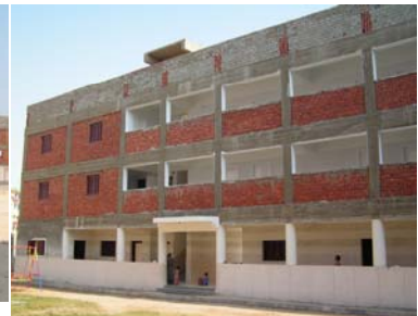
St. Amalia vor dem „Neuen Kindergarten“ Außenansicht